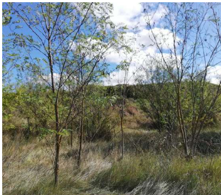
Imagen 3. Ejemplares de falsa acacia que posteriormente fueron eliminados

Se eliminaron varios pies de especies alóctonas que quedaron de la antigua explotación. Principalmente se trataban de ejemplares jóvenes de falsa acacia ( Robinia pseudoacacia ) que se cortaron mediante motosierra (Imagen 3). En total se eliminaron unos 50 pies de falsa acacia de la zona sur de la parcela.