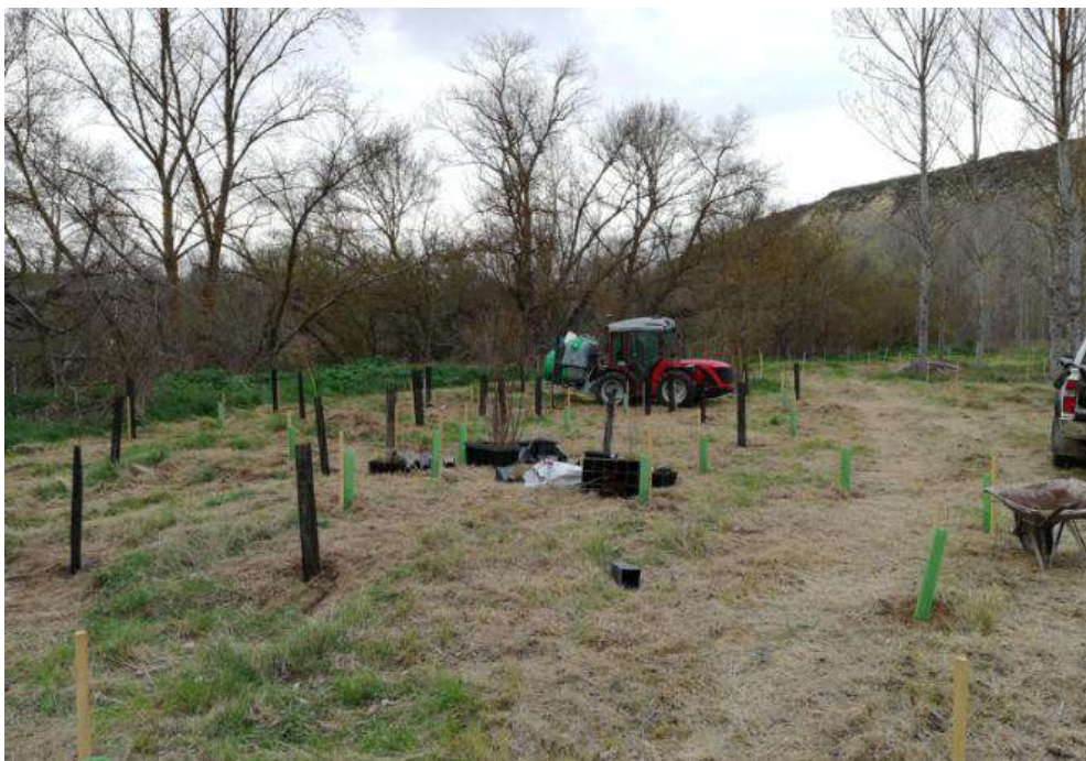
Imagen 6. Núcleo de plantación en la zona norte de la parcela y cisterna tractora (al fondo) para el regado.