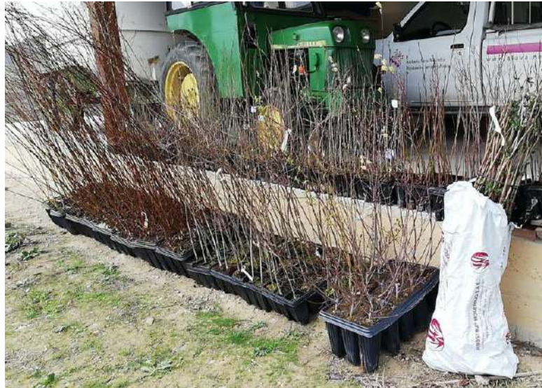
Imagen 4. Parte de la planta adquirida

El resto de individuos se obtuvieron gracias a la colaboración con el vivero provincial de la DFA (Imagen 4) y la adquisición en viveros localizados en Álava (Viveros Eskalmendi).