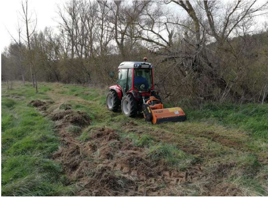
Imagen 2. Desbroce mecánico de zonas de herbazales donde se procedió a plantar posteriormente.