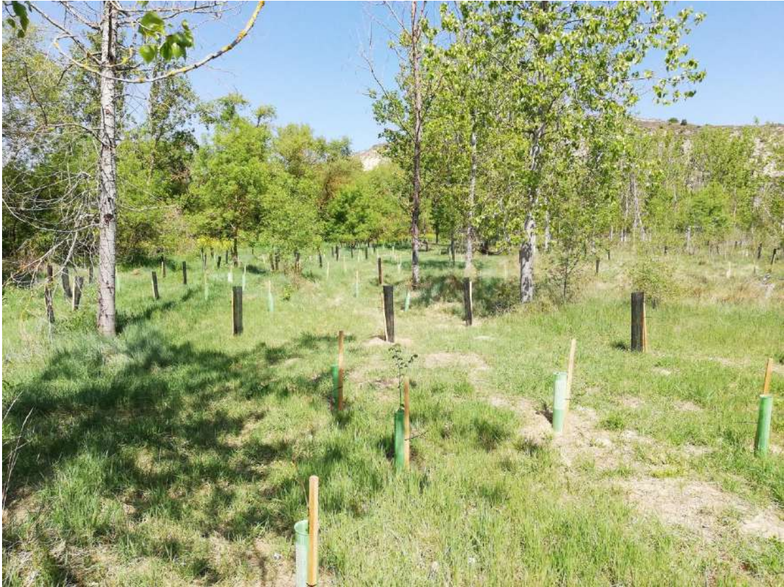
Imagen 17. Estado de la parcela tras las labores de gestión. Septiembre de 2021.