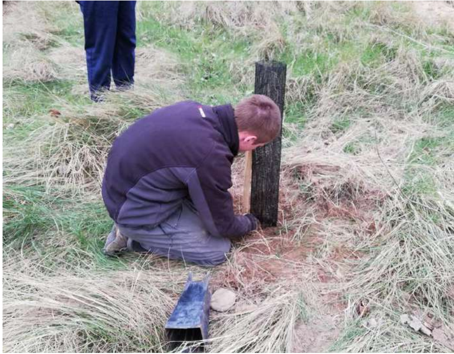
Imagen 7. Plantación manual de Ulmus minor .