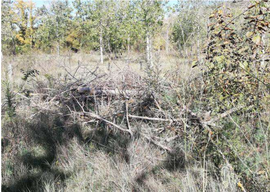
Imagen 10. Zona de refugio para fauna creada mediante la acumulación de troncos, restos de poda y piedras.

Mediante la acumulación de troncos de los chopos talados, piedras y restos materiales orgánicos se crearon refugios para fauna en diferentes zonas de la parcela seleccionada de forma manual (Imagen 10).