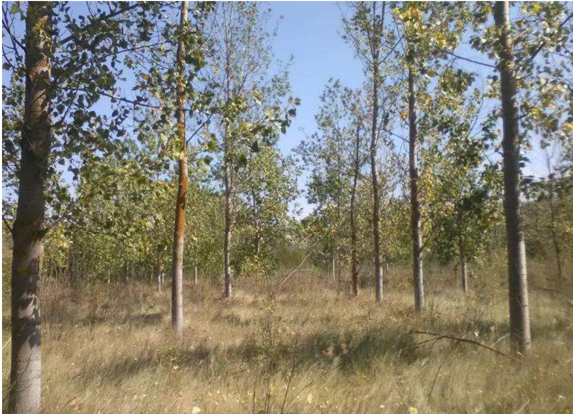
Imagen 16. Estado de la parcela antes de las labores de gestión.

entablado varias reuniones entre la Diputación Foral de Álava, y la Confederación Hidrográfica del Ebro, ya se ha creado un proyecto para crear en la zona norte de la misma parcela, cedida por el Ayuntamiento de Elciego, un humedal y una posterior revegetación de la zona, lo que mejorará el hábitat de muchas especies típicas de ribera muchas de ellas catalogadas, como el visón europeo, la nutria, el sapo de espuelas o los dos galápagos autóctonos.