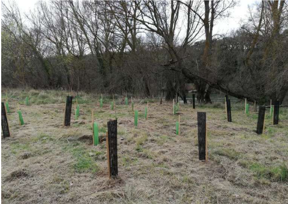
Imagen 5. Individuos plantados en una zona cercana al curso fluvial