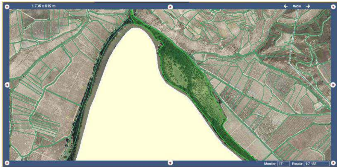
Imagen 1. Parcela donde se llevó a cabo la restauración del bosque de ribera.

Parcela 287, Polígono 5, en concreto en la superficie que coincide con las coordenadas ETRS-89: X: 532784 Y: 4705381 La superficie de actuación son aproximadamente 23655 m 2 .