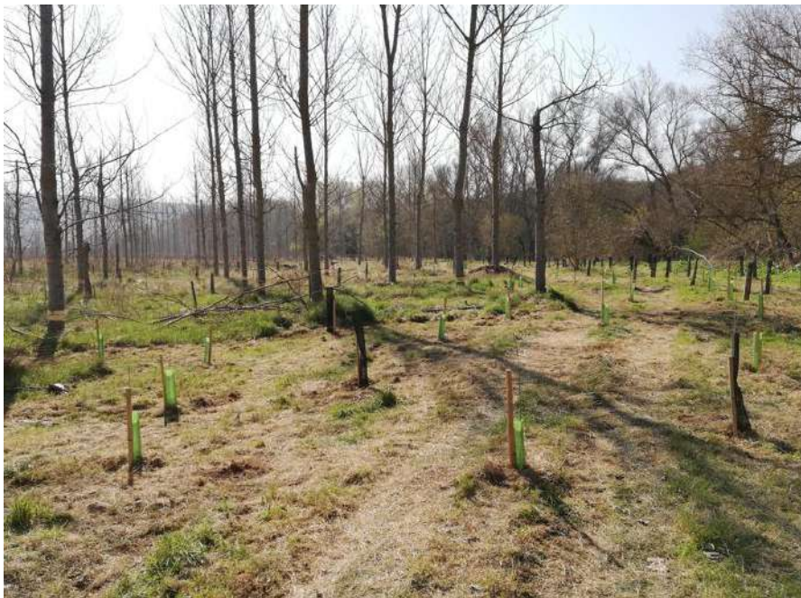
Imagen 8. Estado de la parcela tras la plantación.